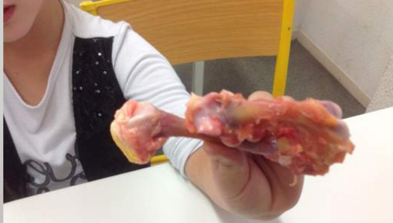
De très belles dissections.