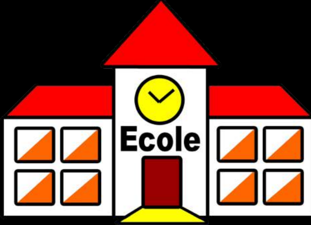
Ecole Saint Exupéry.