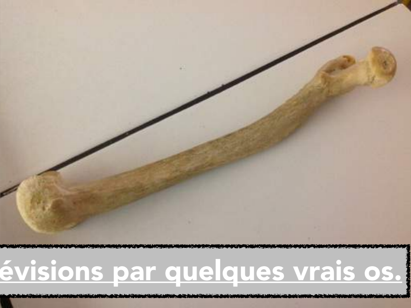
Ils terminent leurs révisions par quelques vrais os.