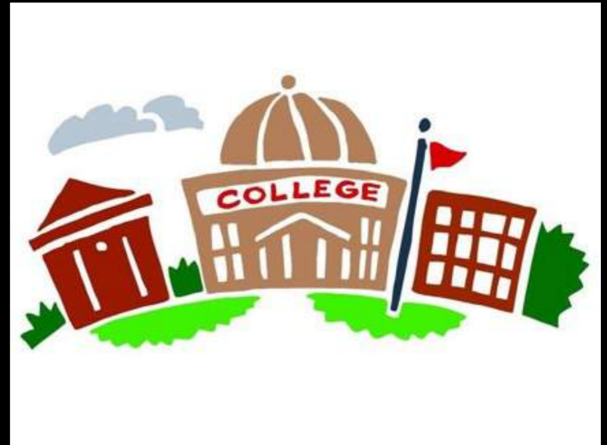
Collège Saint Hilaire.