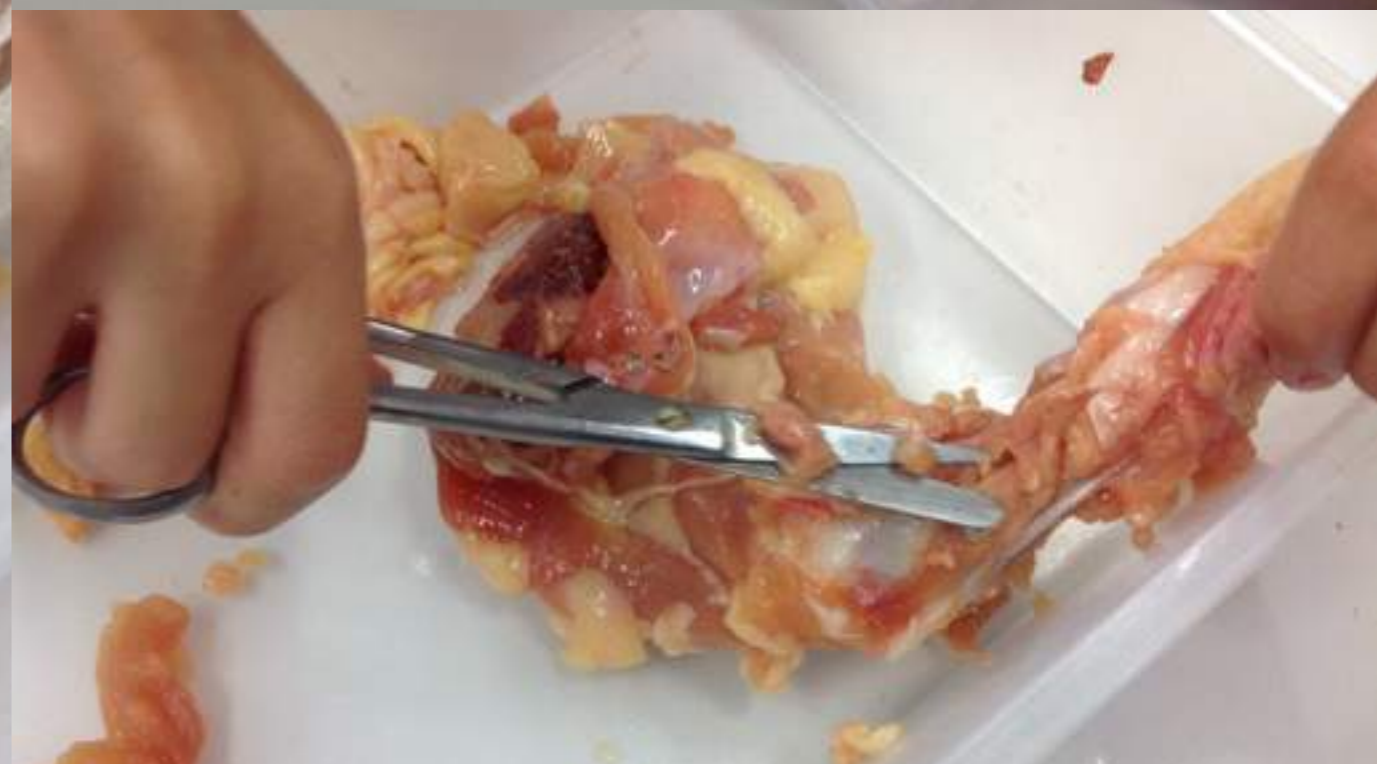
Ils effectuent la dissection d'une patte de poulet.