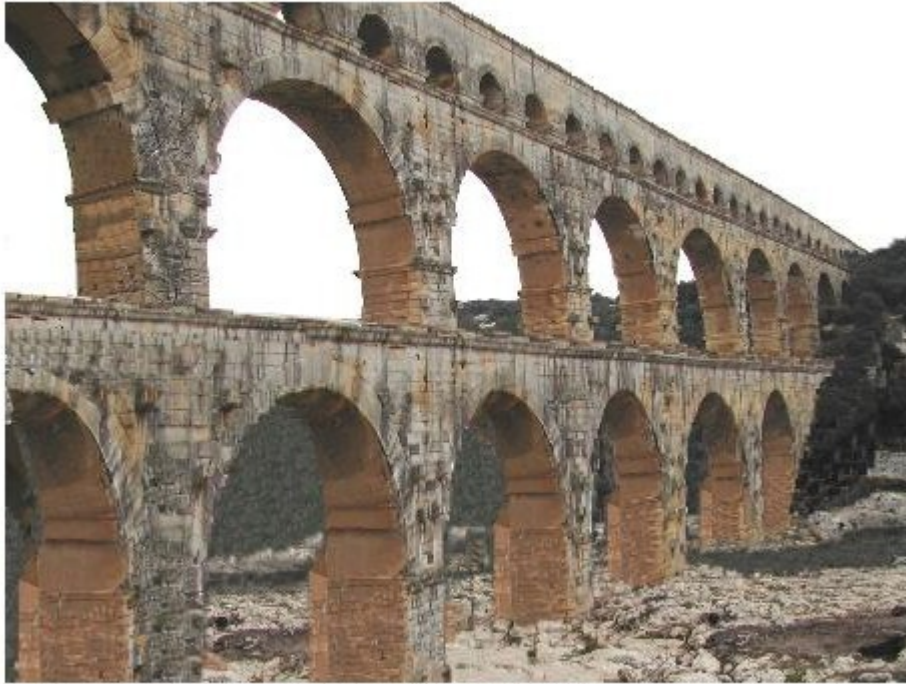
Photo-montage de la DDE30 : Reconstitution du pont du Gard avant la construction du Pont Pilot

Le pont du Gard est un pont aqueduc romains à trois niveaux.