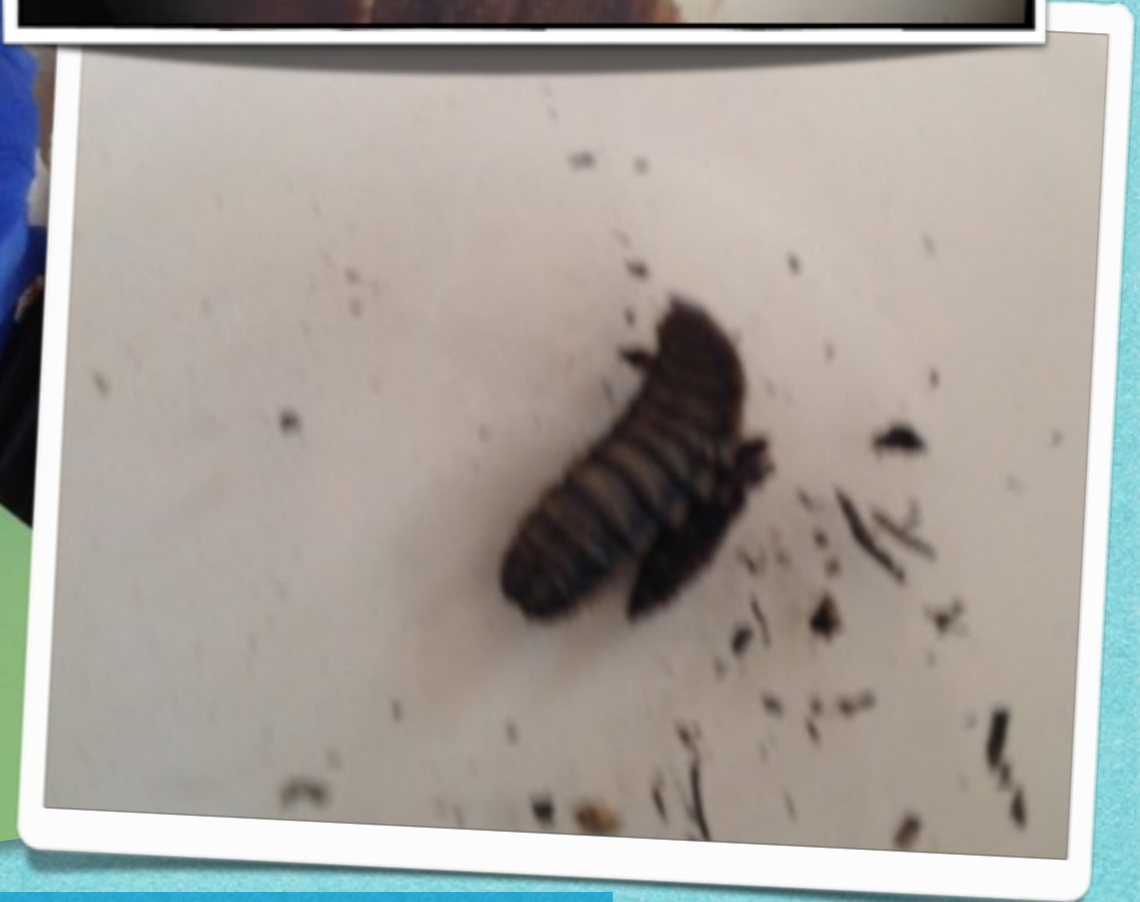
Observation à la loupe binoculaire.