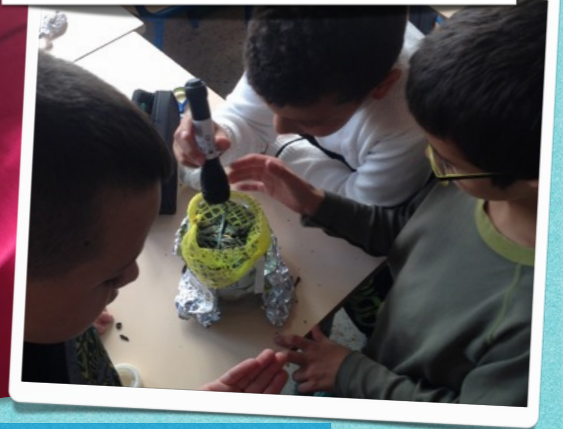
Réalisation et utilisation d'un berlèse.