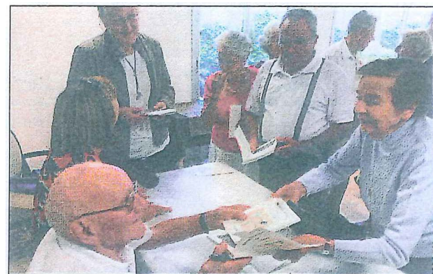
Les plus âgés aussi veulent leur dédicace.